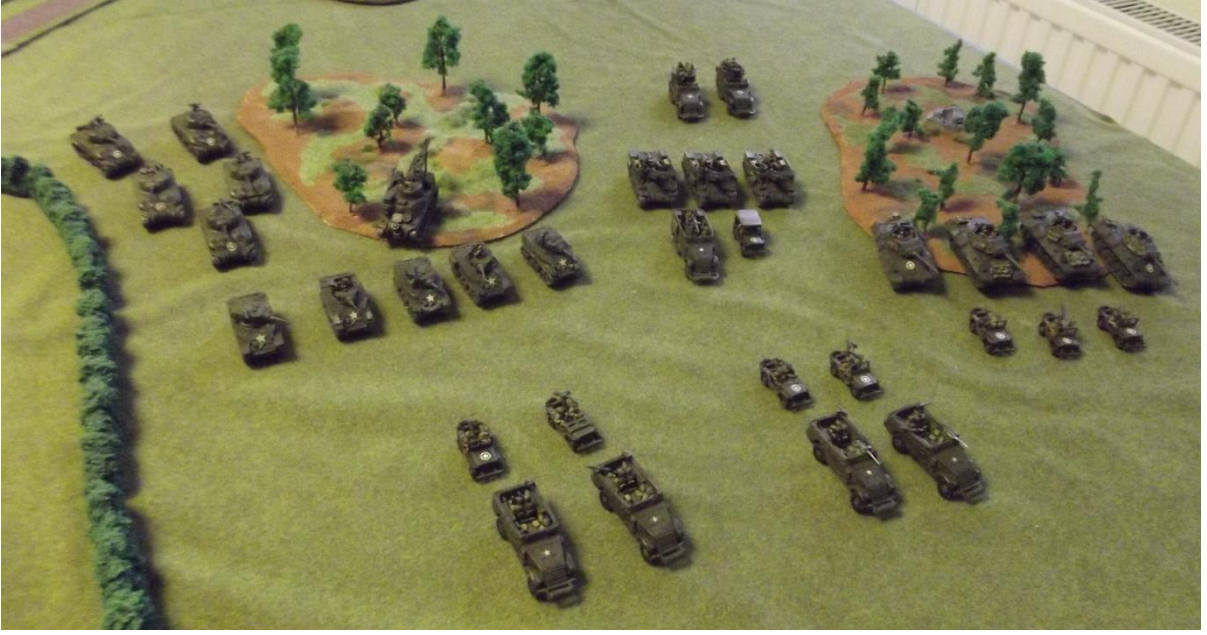
66. Regiment Genel bir görüntü.