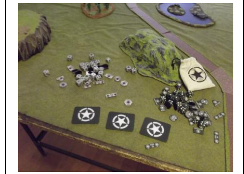
Oyunda kullandığımız zarlar ve objektifler. Ayrıca ünitelerin durumlarını (siperde, vb.) anlatan bazı semboller var. Oynadıkça orduyuza ait zarlar gibi ufak şeyler alıyorsunuz. Görüldüğü üzere zarların ve objektiflerin üstünde Alman Iron Cross'u ve Amerikan yıldızı var.

Tarihsel minyatür savaş oyunu olarak dernek olarak ilgilendiğimiz tek oyun Flames of War. Oyun tarihsel gerçeklere dayanınca arka plan hikayesi çok gelişmiş oluyor. Hangi cepheler kimin arasında yapılmıştan, hangi silahları kullandıklarına kadar gerçek yaşanmış olaylara gönderme yapılarak dizayn edilmiş bir oyun Flames of War. Aslında tüm savaşlar sadece metal ve plastik modellerle yapılmalıdır diye bir umudumuzu ekleyip, oyun hakkında ve daha doğrusu bu seçtiğim maç hakkında konuşmaya başlıyayım.