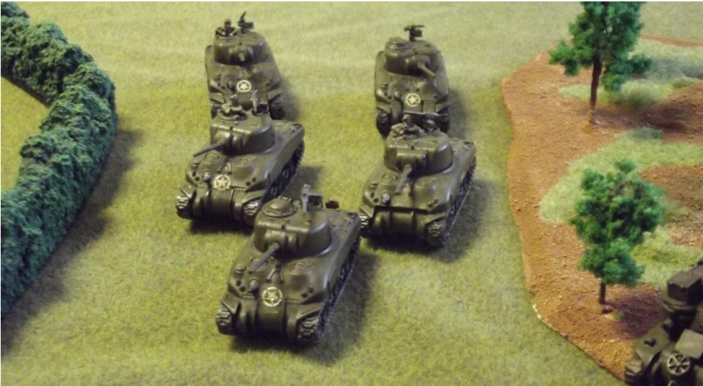
Muhtemelen savaşın en ünlü tanklarından M4A1 Sherman Tankları