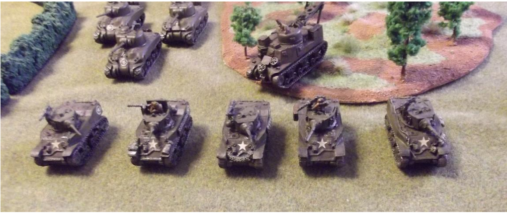
M5 A1 Stuart Hafif Tankı arkalarında ise M31 TRV Tank kurtarma aracı